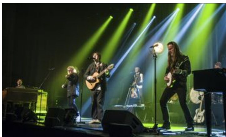
BEST I LEVENDE LIVE: Selv om Vamp har en imponerende plate- og låtkatalog, er de kanskje best på konsert, mener NAs anmelder. Det fikk 360 publikummere i Namsos oppleve onsdag kveld.

NAMSOS: Ni studioalbum, ti gullplater, tre platina, to trippelplatina og fem Spellemannpriser, deriblant Årets spellemann (2006), sier litt om posisjonen til Haugesund-bandet Vamp.