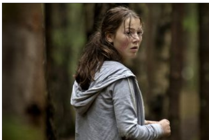
STERK FILM: I filmen om terroraksjonen på Utøya får vi et innblikk i den ufattelige panikken og forvirringa som oppsto.