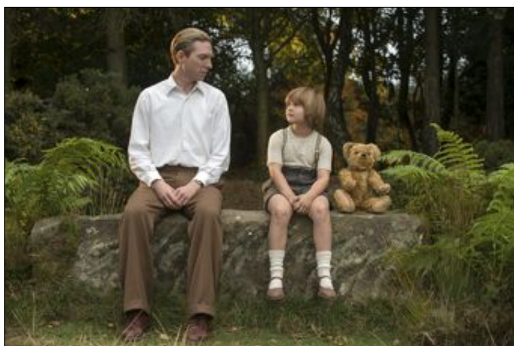
BIOGRAFISK FILM: «Adjø Christopher Robin» handler om historien til A.A. Milne, forfatteren av de populære bøkene om Ole Brumm.

TOR MARTIN ÅRSETH tor.aarseth@namdalsavisa.no 932 25 385