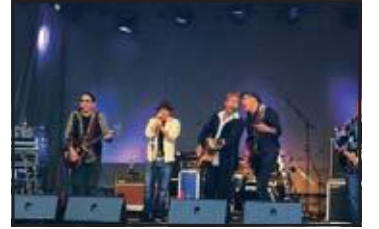
The Real Neils

trommer. Bandet holdt på den akustiske utgaven i flere år før de etter hvert begynte å spille både akustisk og elektrisk. Da skiftet bandet navn til The Real Neils for å signalisere tydeligere hva man spilte. Repertoaret består kun av Neil Young-låter.