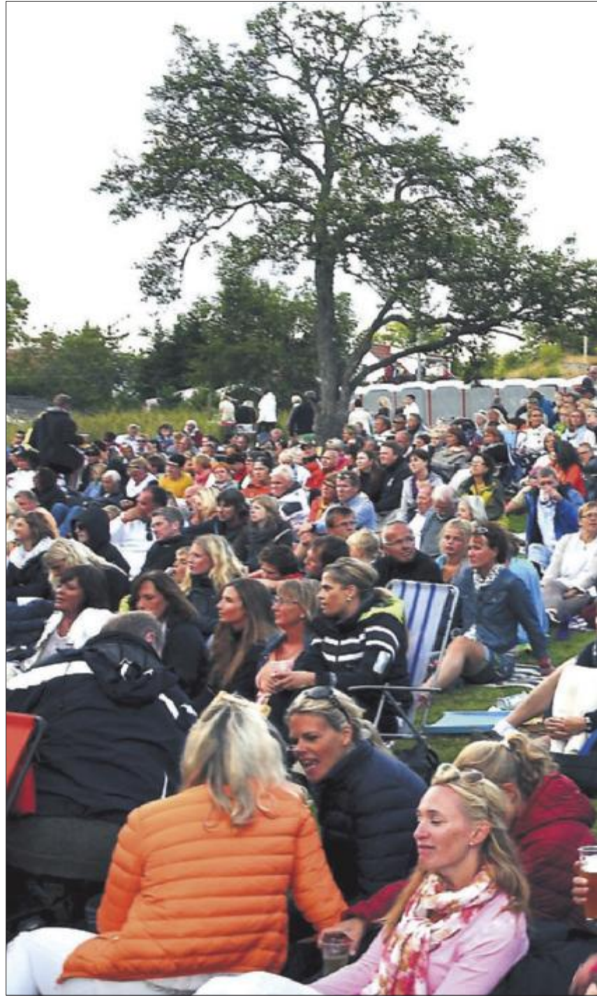
REKORDMANGE: Det har aldri før vært så mange som 1.700 konsertgjenger.