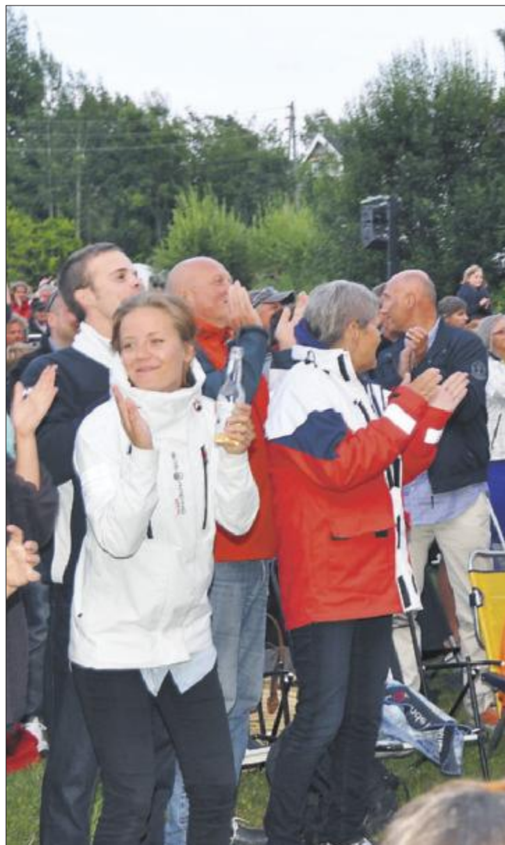
STÅENDE JUBEL: Mot slutten av konserten var det stående jubel, synging, klapping og dansing hos alle.

Kafeens matservering var for øvrig stengt for anledningen. I stedet sto Skåtøy vel for god servering av vått og tørt på konsertarenaen.