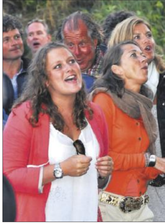
ALLSANG: Mange sang med på Eidsvågs «Alt du vil ha».