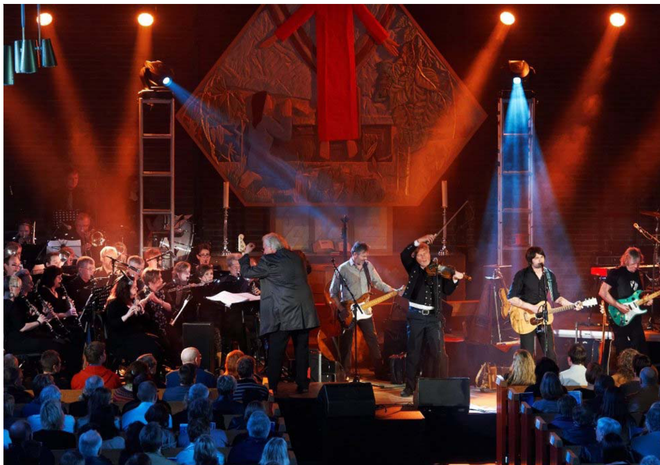
FLOTT: Det ble den jubileumskonsert musikerne i Namsos Musikkorps sikkert hadde drømt om og håpet på. Sammen med den andre 20-årsjubilanten, Vamp, sørget de for en skikkelig flott forestilling i Namsos? kirke.