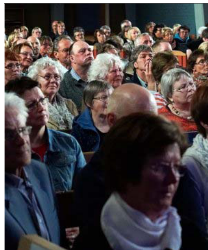
ANBEFALES: Rundt 400 overvar konserten. De som ennå ikke har kjøpt billett, kan absolutt anbefales å gjøre det til kveldens konsert.