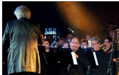
VEL BLÅST: Musikerne i Namsos musikkorps i godt samspill med Vamp.