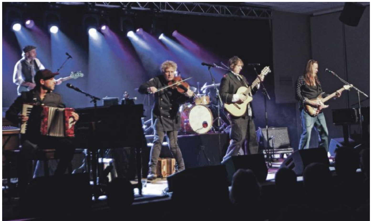
ENERGI: Vamp gav full gass i Vossasalen fredag, og stemninga steig skikkeleg med klassikarar som Liten Fuggel og Månemann.

Vokalisten som har vendt tilbake til bandet, stilte opp med reine