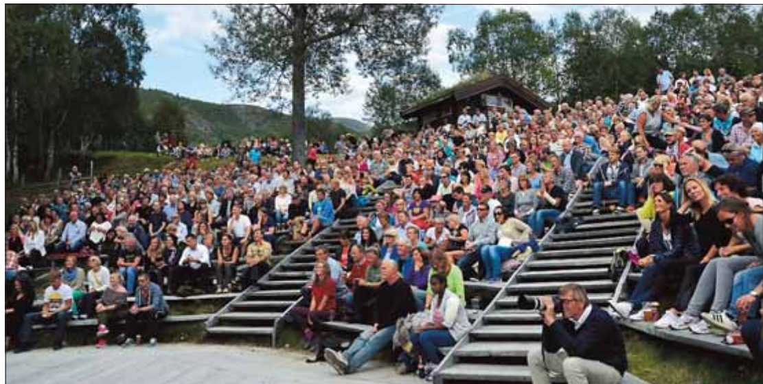
PUBLIKUMSREKORD: Mellom 1200 og 1300 personar var møtt opp for å høyre Vamp.