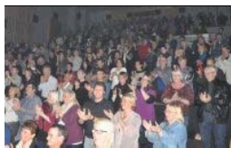
Vamp mottok stående applaus fra et takknemlig publikum etter konserten.