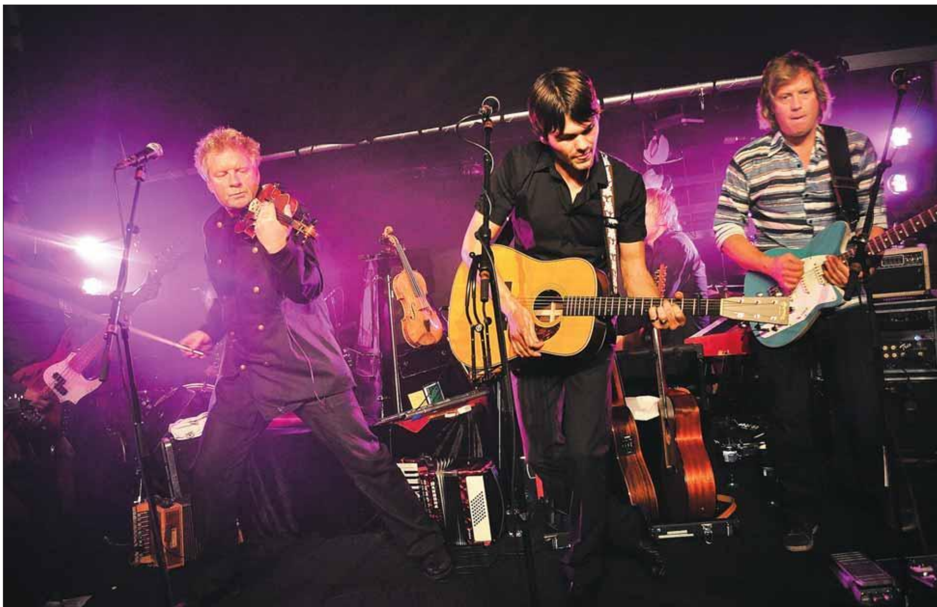
EVENTYR: Med bruk av spennende instrumenter som fele og mandolin skapte Vamp trolsk eventyrstemning i musikken.