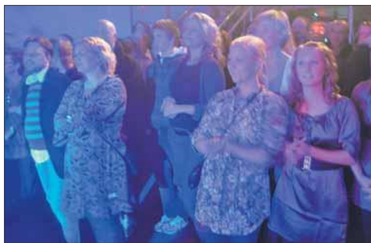
IKKE FULLT: Konserten var ikke utsolgt, med omkring 210 av 400 solgte billetter. De som var der så derimot ut til å kose seg der de danset og sang med til kjente sanger.

Flere slo seg virkelig løs, og danset og sang med til musikken. Særlig de kjente låtene «Tir Na Noir» og «Månemannen» så ut til å gjøre at folk slapp de fleste hemninger og henga seg til dansen.