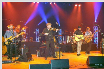
Vamp leverte rein nytelse, visuelt, musikalsk og lyrisk på Rauma kulturhus.