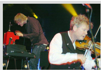
PÅ KONSERT Vamp

Publisert lørdag 28. mars 2009 kl. 10:50.