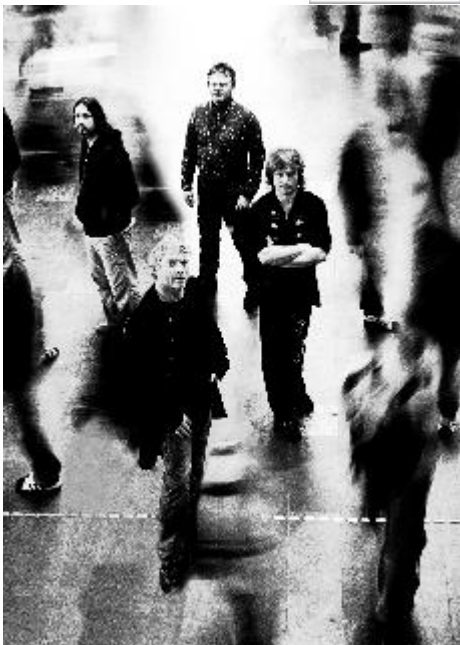
ÅPNER I BERGEN: Vamp åpner norgesturneen sin i Bergen, og det med hele syv konserter på Ole Bull Scene.